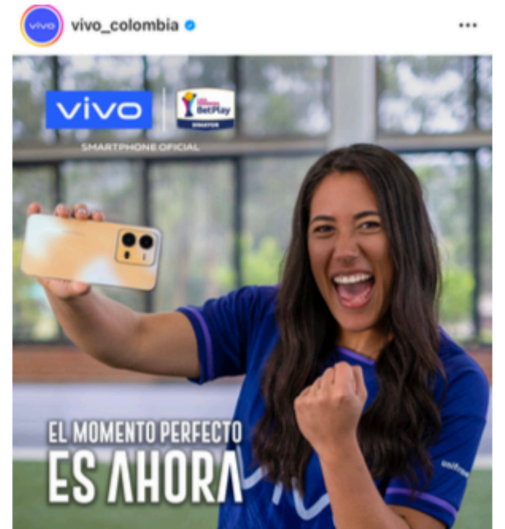
Embajadora vivo 2023 |