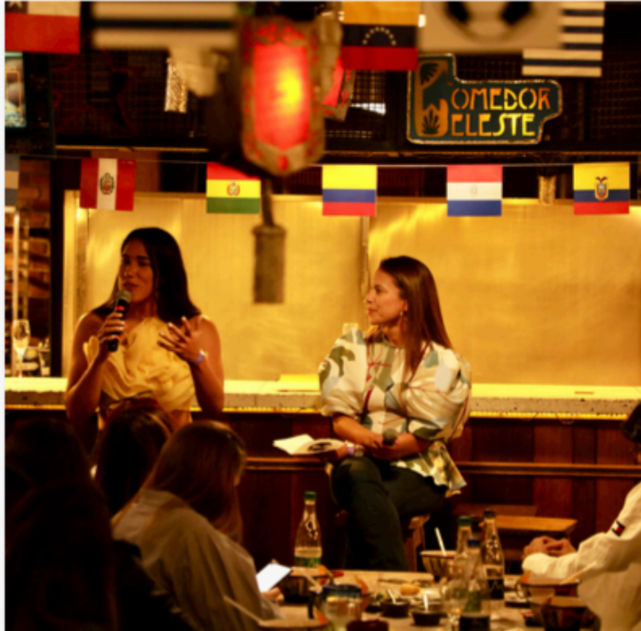
Embajadora de Mastercard durante Copa América Femenina 2022 #MomentosPriceless