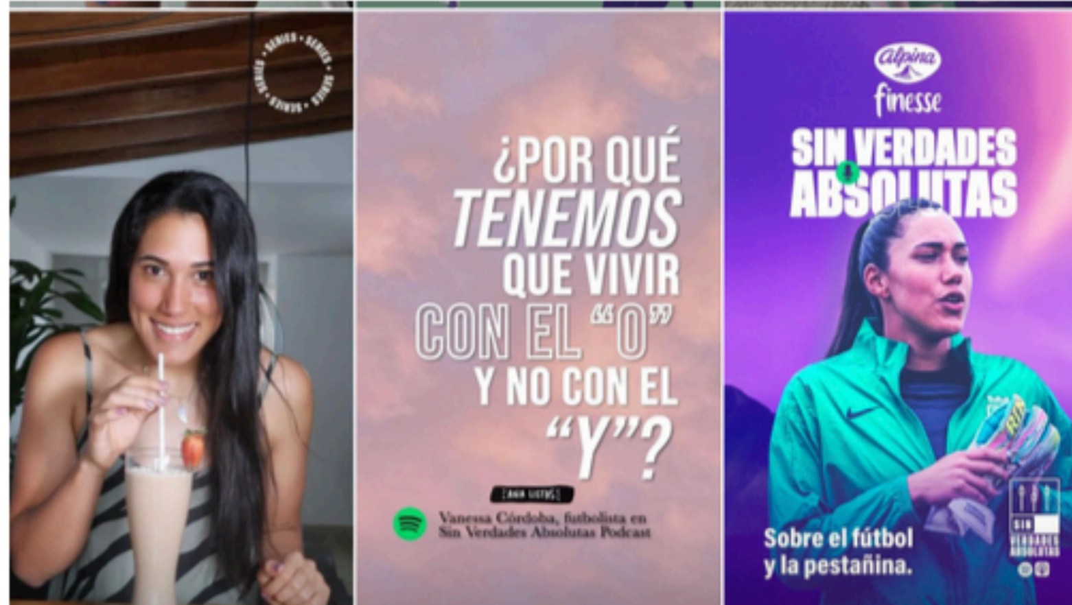
Embajadora Finesse 2023