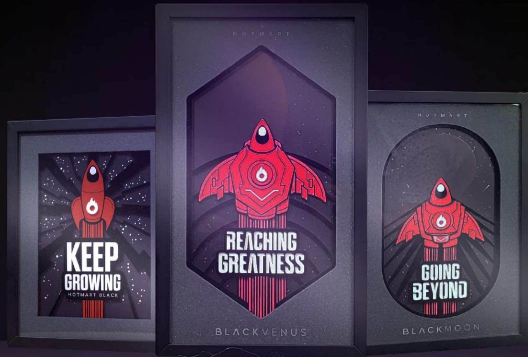
Hotmart Black, Moon & Venus