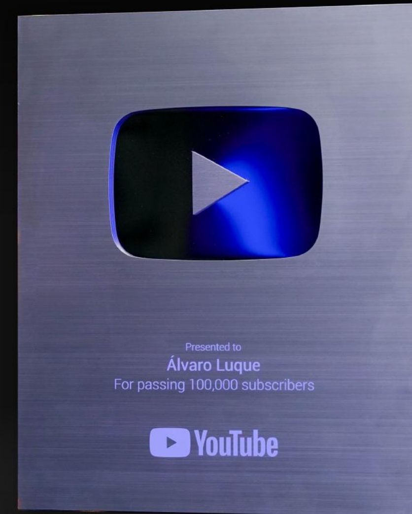
YouTube Silver Play Button por superar los 100 mil suscriptores